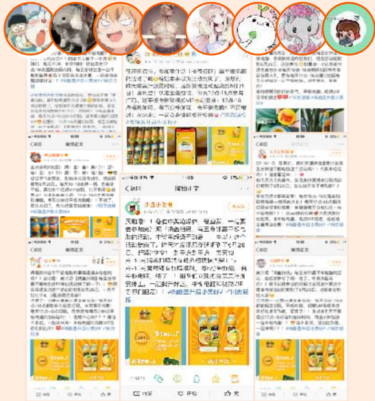
微博头部综合、锦鲤、生活、薅羊毛类、美食KOLs