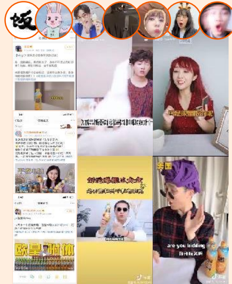
抖音、微博剧情类、开箱类KOLs