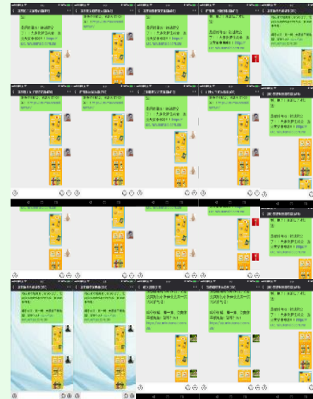
一二线城市群/电商群薅羊毛群/购物群