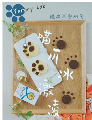
伊利X奥利奥 喵爪冰激凌