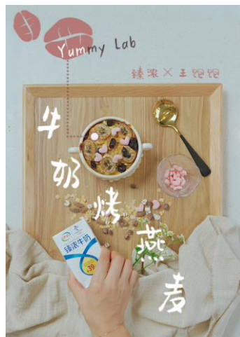
伊利X王饱饱 牛奶烤燕麦