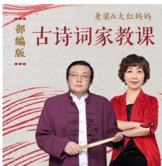
《老梁&大红妈妈：部编版古诗词家教课》