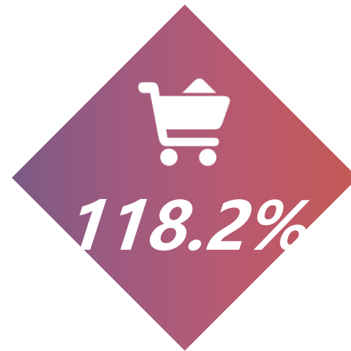
华为nova 5预购度提升率