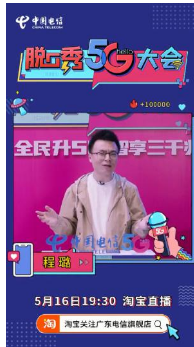
《是时候升5G》篇 视频链接：

https://v.qq.com/x/page/o3120c1c4sq.html