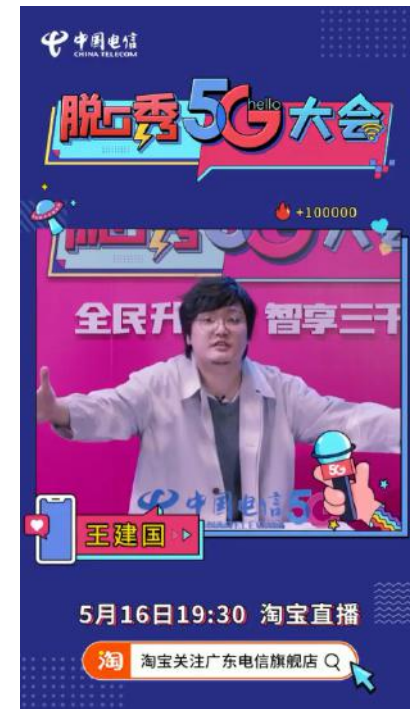
《权益就要PLUS》篇视频链接：

https://v.qq.com/x/page/b31208owo46.html