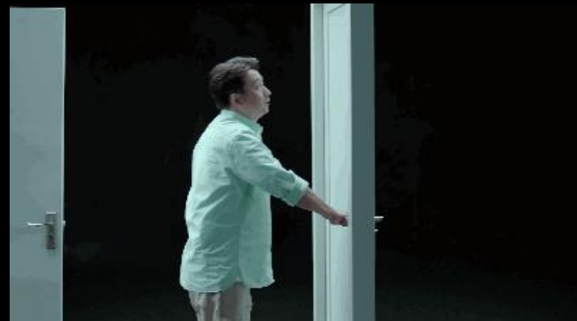
爸爸穿越孩子心门的道路