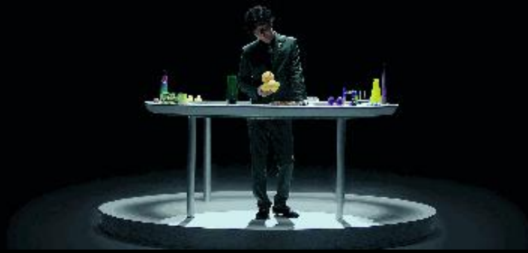
世界冠军和奶瓶的追逐